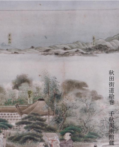
秋田街道絵巻 千秋美術館蔵